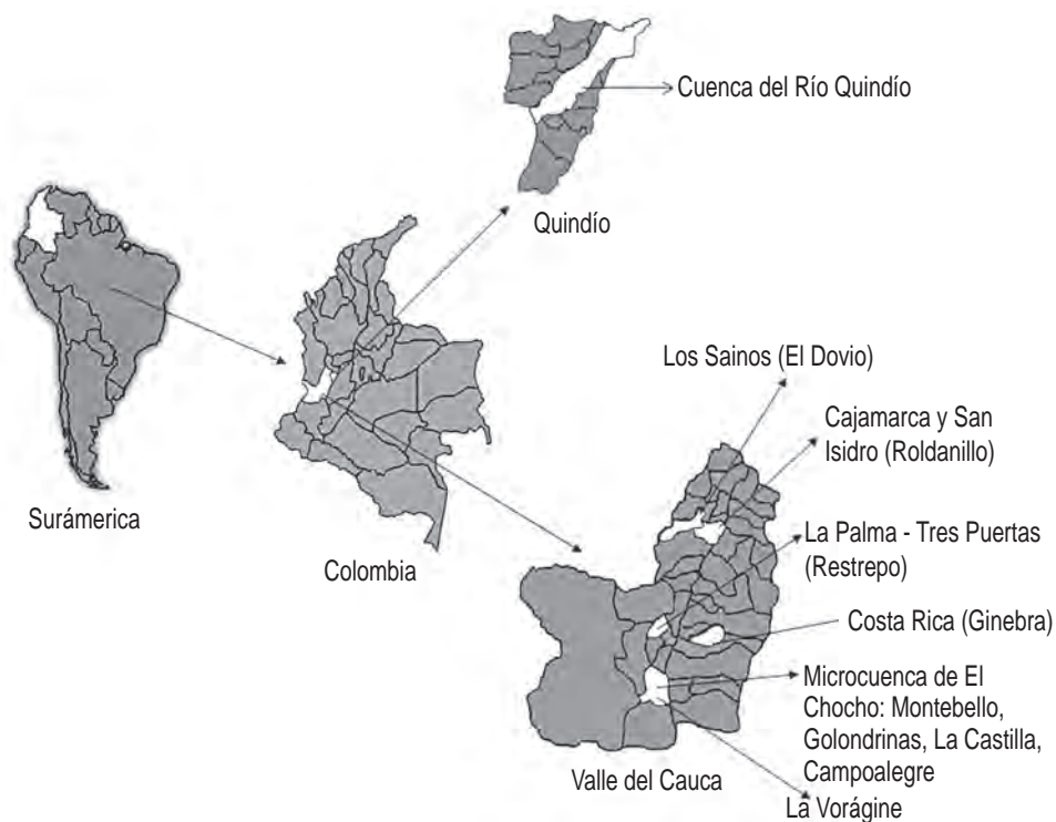
Figura 4.2 Áreas de estudio del proyecto Usos múltiples del agua como una estrategia para reducción de la pobreza.