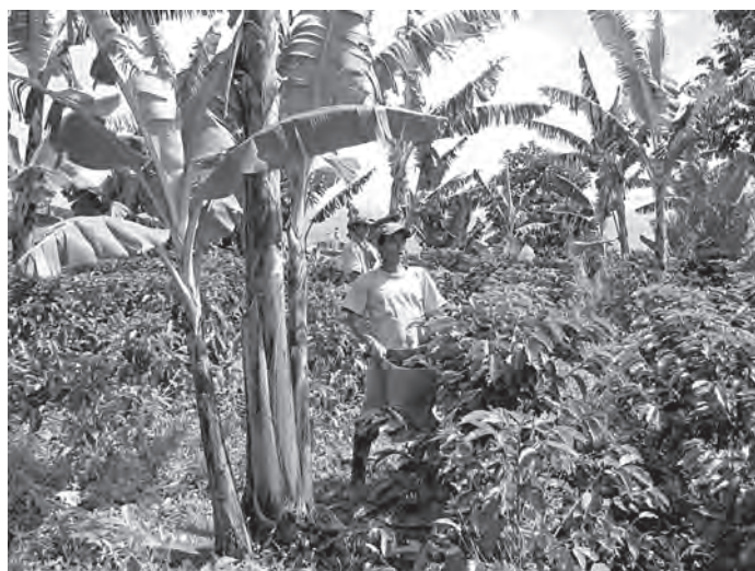
Fotografía 9.1 Finca cafetera típica del Quindío.