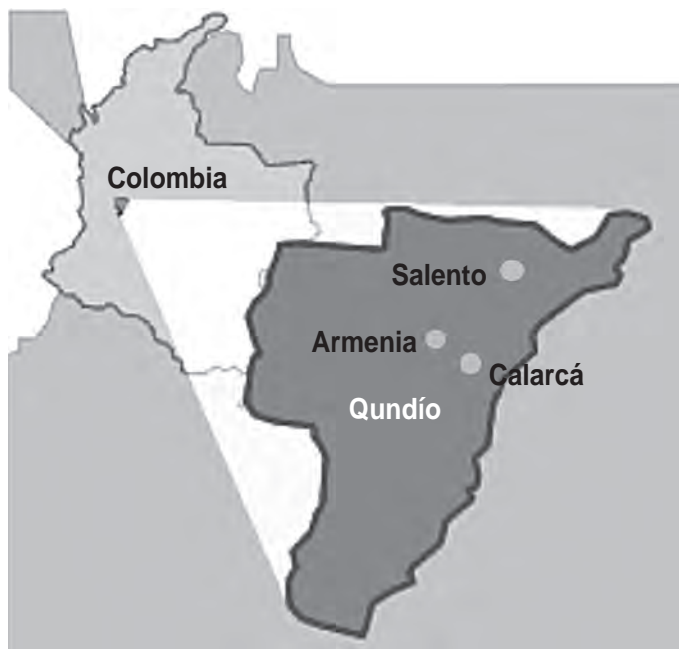
Figura 9.1 Salento y Calarcá en el Departamento del Quindío.

Dentro de los estudios realizados en el proyecto internacional Usos múltiples del agua como una estrategia para enfrentar la pobreza se escogió el Departamento del Quindío (figura 9.1) debido a sus características particulares socioeconómicas y a sus diversas actividades productivas tales como las agropecuarias, en donde el recurso agua juega un papel fundamental para su desarrollo. Las fincas productivas estudiadas son de tamaño pequeño, típicas de la zona cafetera colombiana. La actividad cafetera en Colombia se produce en minifundios. El 95% de las fincas cafeteras colombianas tiene menos de 4 ha. Su propiedad está en manos de personas de clase media alta y generan el empleo de la zona rural.