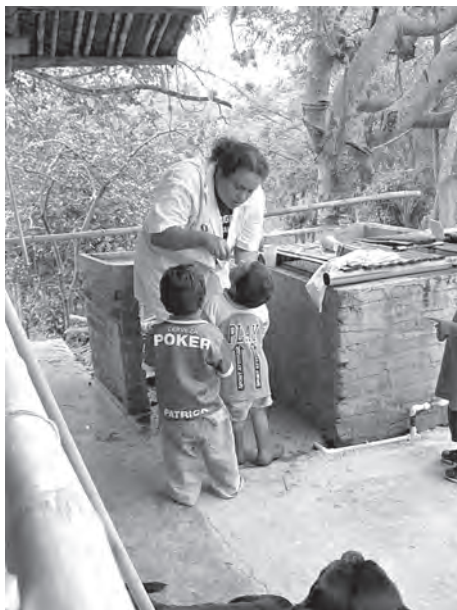
Fotografía 13.1 El agua para el lavado de dientes debe ser potable.

La demanda de agua para actividades domésticas está comprendida fundamentalmente por el agua para la bebida, agua para la preparación de alimentos, agua para la ducha y agua para el saneamiento (fotografía 13.1). Howard y Bartram (2003) establecen que un mínimo básico de suministro de agua para la protección de la salud corresponde a 20 l/hab día, de los cuales, 7,5 l son para bebida y preparación de alimentos. Cuando se quiere considerar la demanda de agua para los animales, se debe conocer en la zona del proyecto, el número de animales por vivienda, las especies a las que pertenecen, si están libres o estabulados. Para uso agrícola se requiere identificar el tipo de cultivos principales en la zona de proyecto y el área sembrada para cada uno de ellos. Se deben tener en cuenta aspectos climáticos e hidrológicos de la zona, y otros factores como tipo de suelo y método de riego empleado. Deben reconocerse otras actividades agropecuarias que también demandan agua, como el beneficio del café y la fumigación, entre otros. Además, pueden existir actividades como la venta de almuerzos, preparación de dulces, pan, lavado de carros, lavado de ropa, turismo, y un sin fin de medios a través de los cuales la gente busca garantizar su sustento. Estas actividades también requieren agua y por tanto, deben ser identificadas y caracterizada su demanda para incorporarla en la planificación, en caso de que se haya establecido que es significativa.