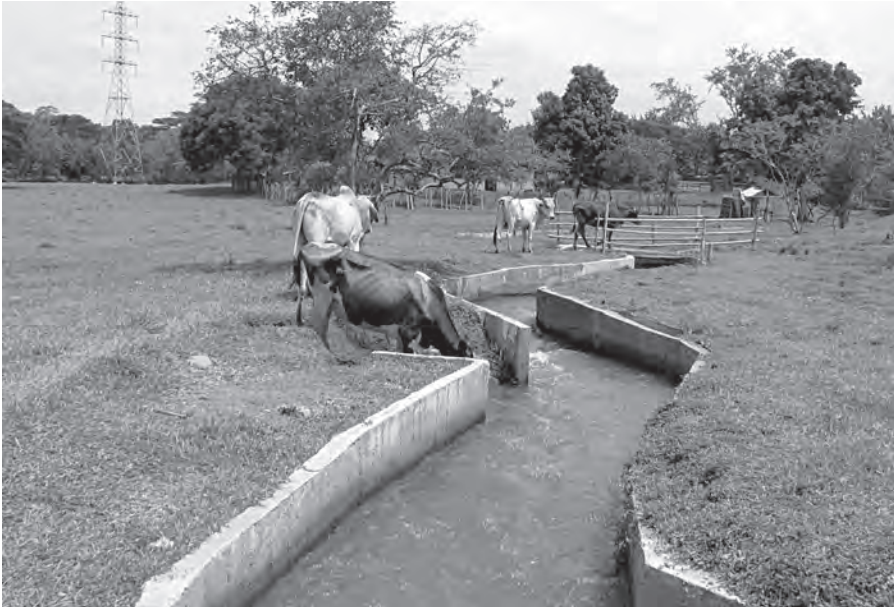
Fotografía 13.2 Canal de irrigación que permite la entrada de ganado.

Además de considerar los aspectos de cantidad, se requiere establecer riesgos en términos de calidad para las diferentes fuentes. El proyecto de usos múltiples debe realizar una evaluación de las situaciones que pueden tener impacto sobre la calidad de las fuentes con potencial de aprovechamiento. Estas situaciones pueden condicionar los usos del agua, las necesidades de tratamiento y los costos asociados a estas. Para establecer los riesgos de calidad de las diferentes fuentes se propone identificar las situaciones generadoras de impacto, y cuantificar estos impactos para tomar las acciones que permitan aprovechar la oferta hídrica de manera segura. En estas actividades es fundamental la participación de la comunidad.