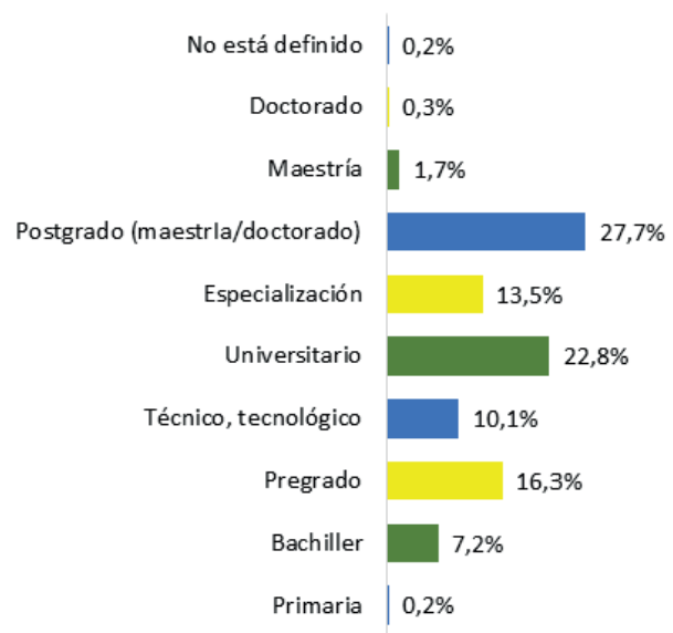
Figura 5. Nivel de formación

El rol, como una caracterización de los Actores en el Sistema de C&CTI del Valle del Cauca, en la dimensión de instrumentos de la gobernanza pone en el contexto de la articulación de la gobernanza la fuerza, la intención y la capacidad de toma de decisiones, por ello, se consideró un instrumento titulado Taller para la evaluación de roles de los actores en la gobernanza del SCT&I del Valle del Cauca (tabla 7), con la participación de los actores de las cuatro hélices, y de la Banca.