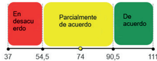
Figura 37. Eje de concordancia entre la investigación, ODS y coordinación de esfuerzos

Para calcular los rangos de este eje se siguió la misma estructura del eje anterior. Primero se tomaron las categorías de las variables de interés: con el valor de 1 para la categoría nulo, 2 escaso, 3 apenas suficiente, 4 suficiente y 5 muy suficiente. Para simplificar el análisis, se agruparon las categorías 1 y 2 en la categoría escaso (E) y se asignó el valor de 1, la categoría apenas suficiente (M) pasó de tener un valor de 3 a 2 y las categorías 4 y 5 se agruparon en la categoría suficiente (S) con un valor de 3.