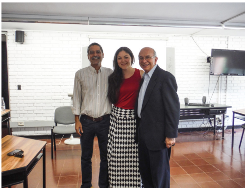
Acto de sustentación de la primera Tesis Doctoral en la línea de Psicología del Trabajo y las Organizaciones.