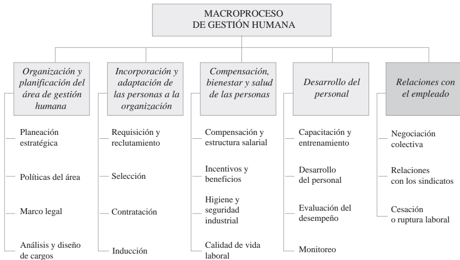
Figura 5.1. Macroprocesos de gestión humana

Este Macroproceso tiene como objetivo mantener las relaciones laborales empleado-patrono, en donde, se distinguen por ser tanto legales como legítimas. Este macroproceso involucra la negociación colectiva y la relación con los sindicatos si los hay, la cesación o ruptura laboral que garantiza la terminación legal del vínculo del empleado y la organización.