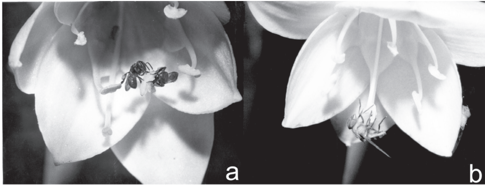
Fig. 3.1 Insectos que visitan las flores de Eucharis caucana . (a) Plebeia sp. nov. (Hymenoptera: Apidae); cuerpo del insecto: 5 mm de largo. (b) Copestylum vagum (Wiedemann) (Diptera: Syrphidae); cuerpo del insecto: 8 mm de largo.

Insect visitors to flowers of Eucharis caucana . (a) Plebeia sp. nov. (Hymenoptera: Apidae); insect body: 5 mm long. (b) Copestylum vagum (Wiedemann) (Diptera: Syrphidae); insect body: 8 mm long.